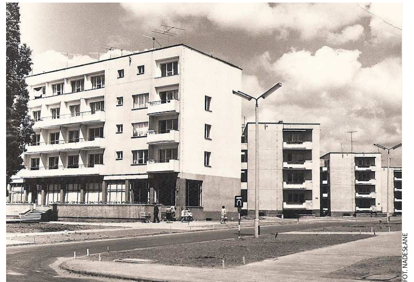
Osiedle Młodych budynki przy ul. Kraszewskiego i Moniuszki (1960-1964)