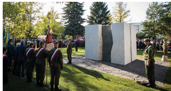
fol. Andrzej Goiński

Przy ulicy Uniwersyteckiej w Toruniu stanął pomnik Pamięci Ofiar Zbrodni Pomorskiej - symboliczne miejsce upamiętnienia polskich cywili, bestialsko zamordowanych przez niemieckich okupantów w pierwszych miesiącach drugiej wojny światowej. Uroczyste odsłonięcie odbyło się 6 października.