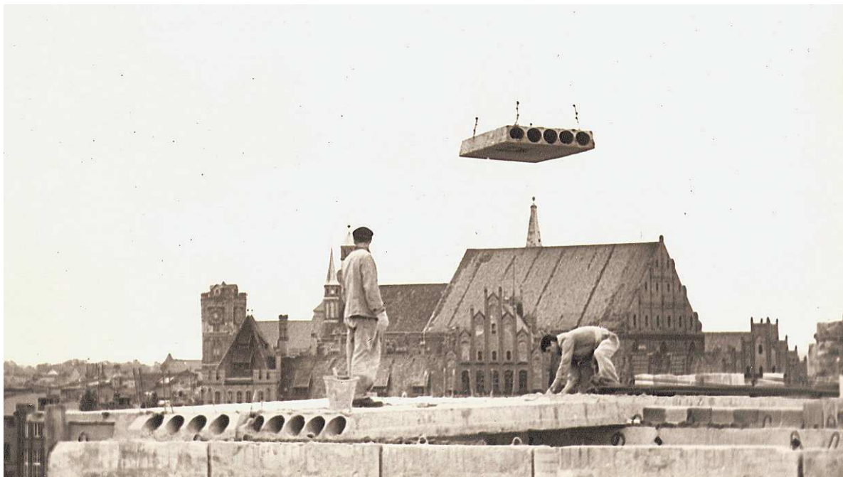
Osiedle Młodych budynek przy ul. Kraszewskiego 2 w trakcie budowy (1967)