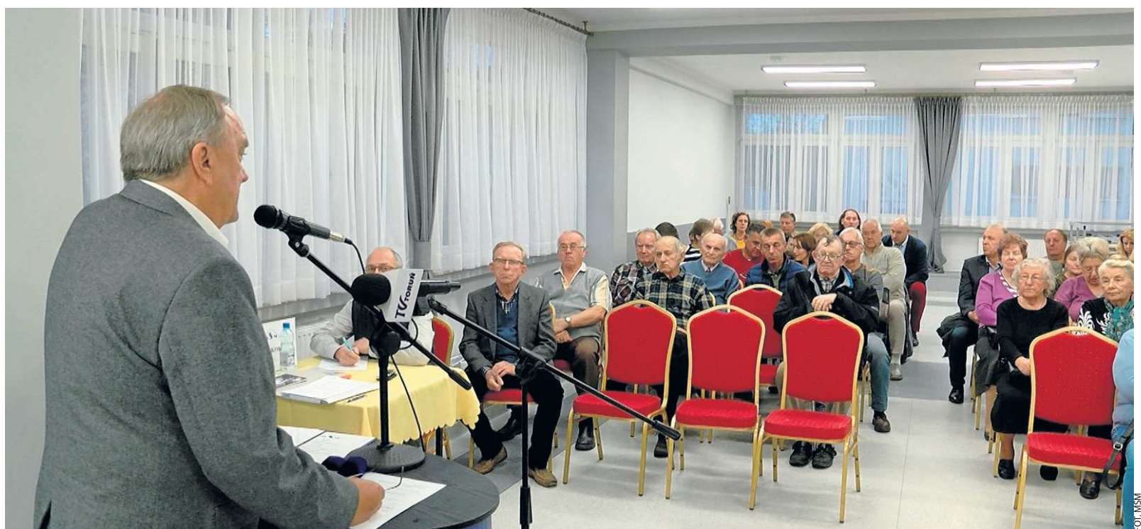
Jedno ze spotkań z mieszkańcami MSM w klubie „Sobotka”

Zgłaszano problem zbyt małej ilości pojemników do selektywnej zbiórki odpadów oraz wystawianie przez mieszkańców poza harmonogramem wywozu, przedmiotów wielkogabarytowych. Dla zwiększenia bezpieczeństwa na Osiedlu Lelewela i Kołłątaja wnioskowano o montaż dodatkowych kamer. Mieszkańcy Osiedla Jar zgłoszili wniosek o przebudowę wjazdu