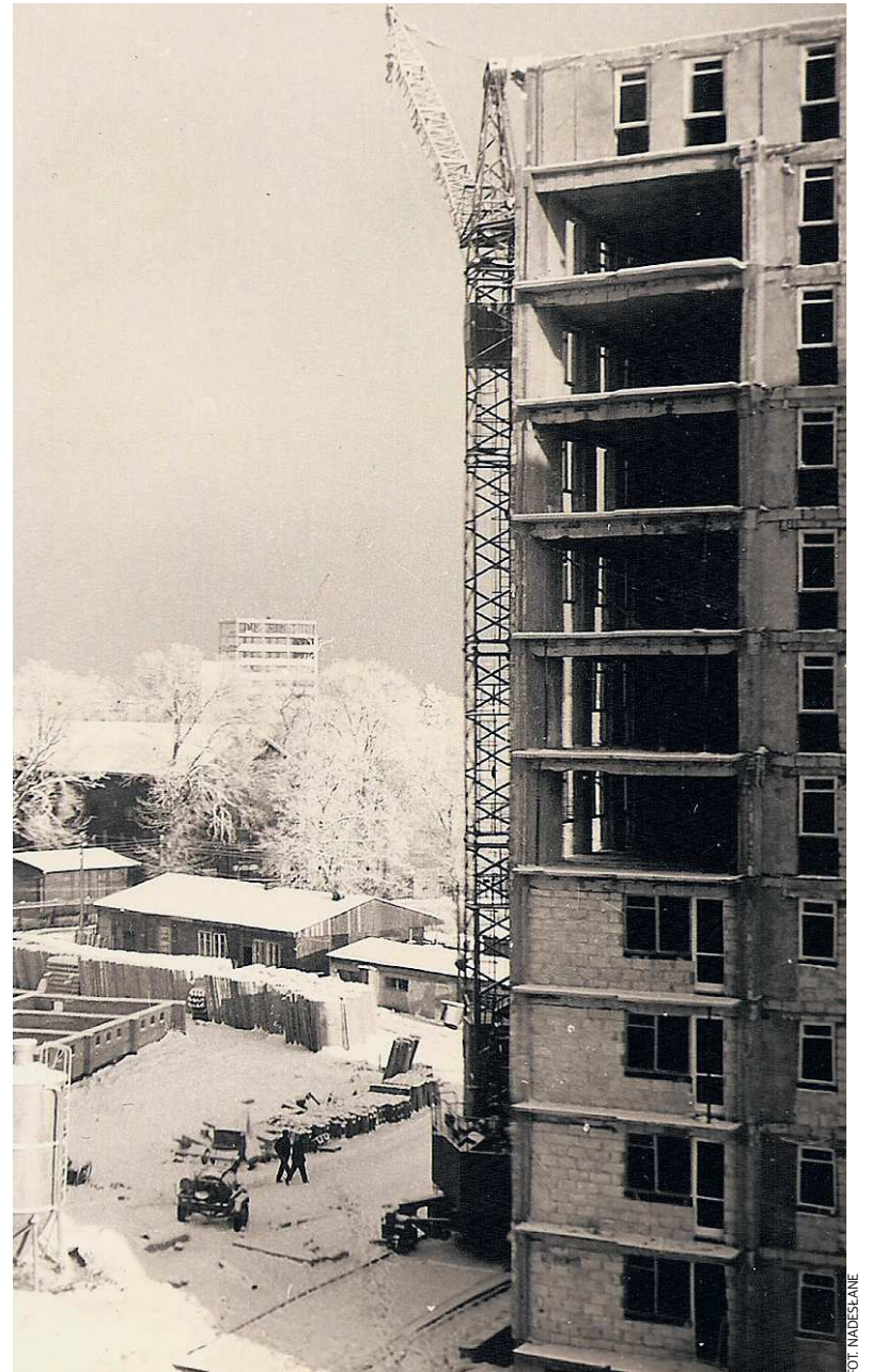
Osiedle Młodych 1966r. budynek al. 700-lecia w trakcie budowy