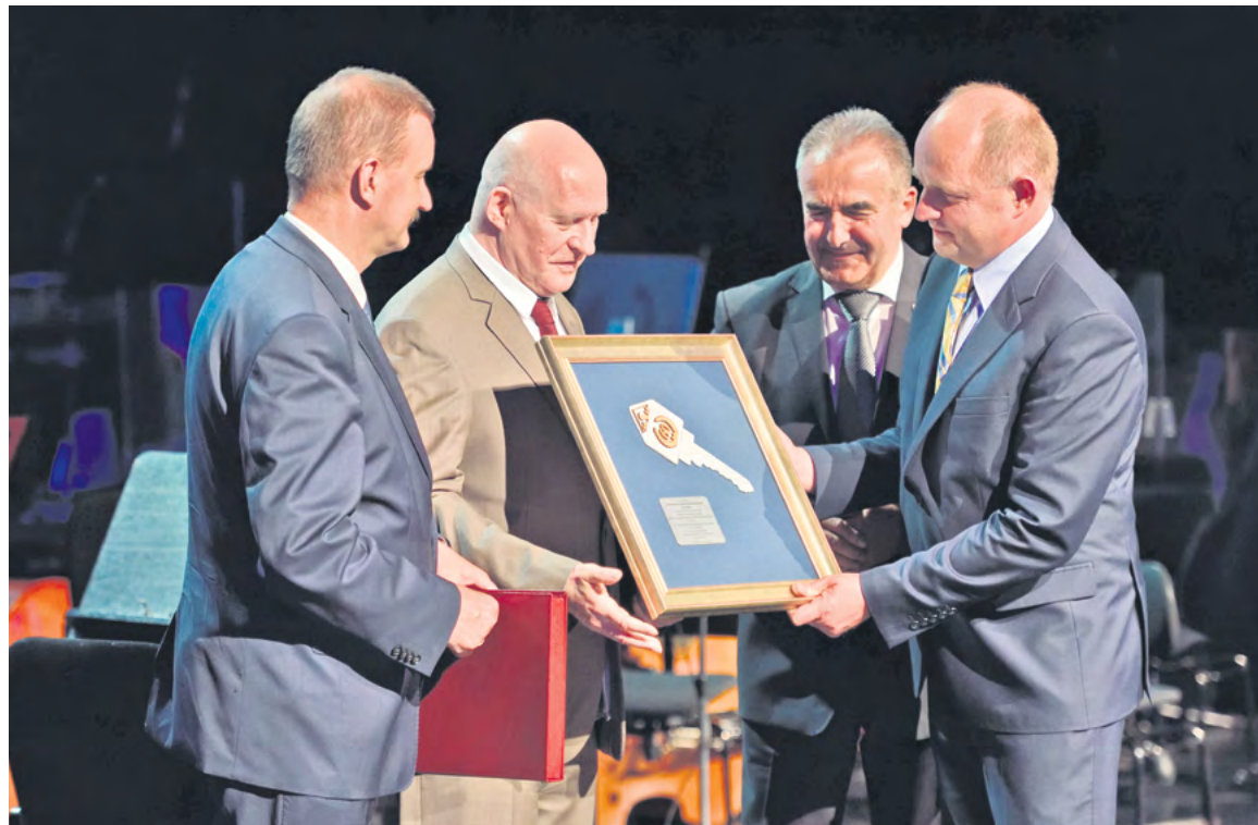
Fot: Uroczystość Jubileuszu 60-lecia MSM

Posługując się w rachunku efektywności ekonomicznej inwestycji mieszkaniowych zasobem mieszkaniowego majątku trwałego oraz strumieniami czynników jego reprodukcji, pamiętać trzeba, że wielkości te należą do tzw. miar nakładów, czyli wielkości wyrażających koszty. Miarami nakładów są również rzeczowe efekty inwestycji mieszkaniowych, bowiem powstają w wyniku poniesionych kosztów. Poruszanie się w wokół miar nakładów stawia pytanie o „cenę” osiągnięcia postępu w zaspokajaniu potrzeb mieszkaniowych i jej długookresowe zmiany. Za długowieczność zasobu mieszkaniowego trzeba współcześnie niemało płacić w bezpośrednim, krótkookresowym wymiarze ekonomicznym. Owo niemałe bieżące płacenie generuje przy istniejącym paradygmacie rynkowego wzrostu