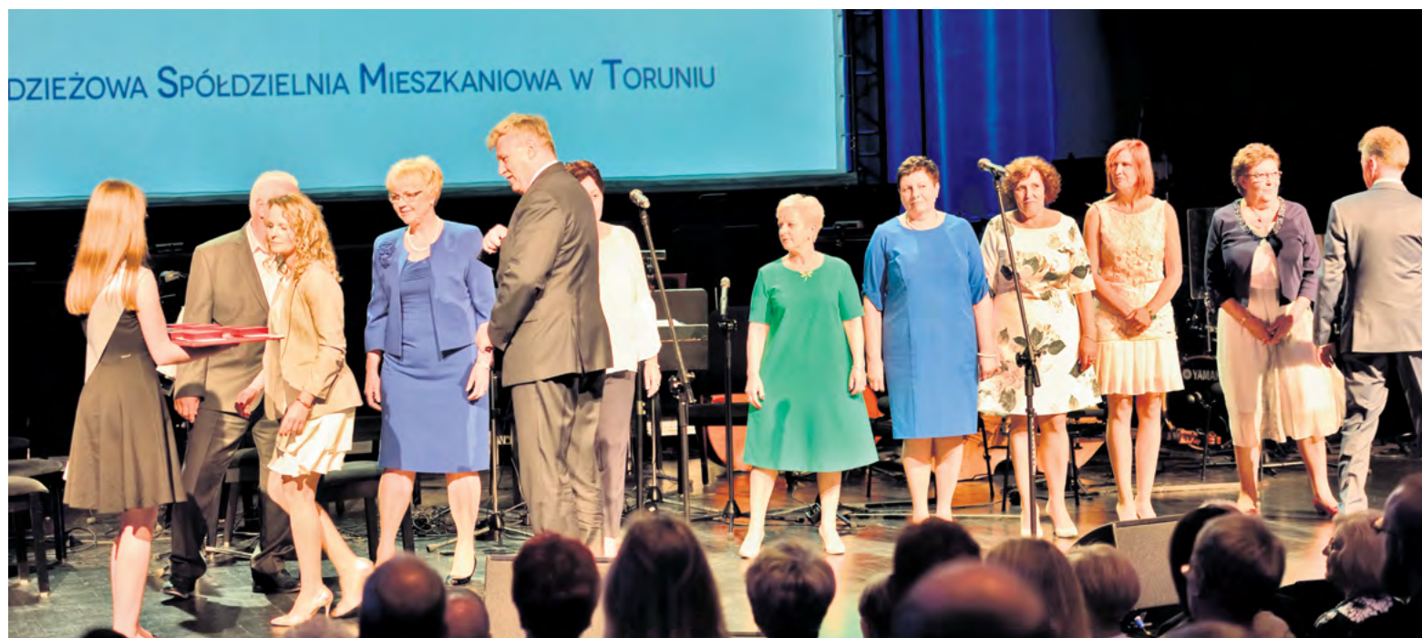
Fot: Uroczystość Jubileuszu 60-lecia MSM

(Tytuł pochodzi od redakcji „Nasze Sprawy”)