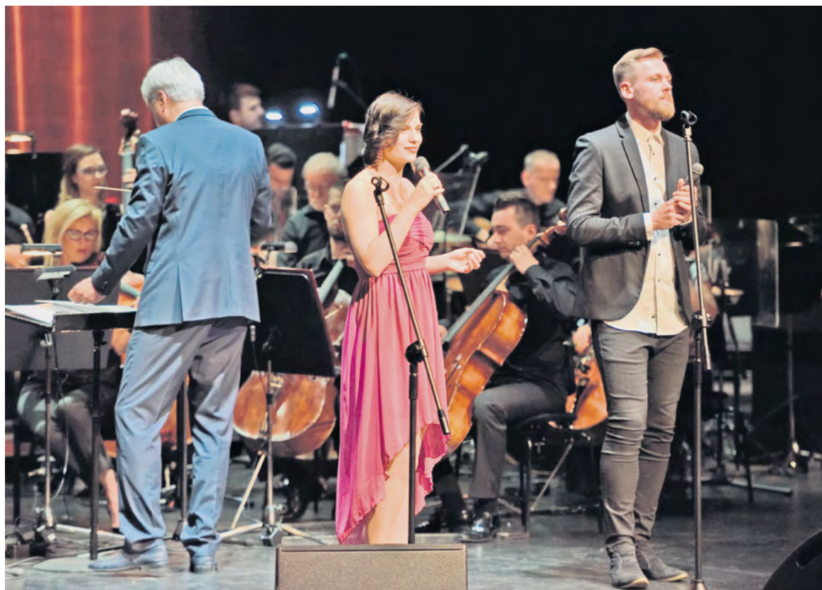
Fot: Uroczystość Jubileuszu 60-lecia MSM

Gospodarowanie społeczne konieczne do istnienia cywilizacji prowadzone może być do wskazywanych w koncepcji trwałego rozwoju trzech wymiarów: społecznego, ekonomicznego i przyrodniczo-ekologicznego. Rozwój cywilizacyjny równoważący wymiar ekonomiczny ze społecznym i przyrodniczo-ekologicznym, a więc trwały rozwój podporządkowany humanistycznemu społecznemu megacelowi przetrwania gatunku ludzkiego stanowi nieosiągalną w pełni, acz niezbędną perspektywę. Zaznaczające się specyfika, zakres i mankamenty rachunku makroekonomicznej efektywności inwestycji mieszkaniowych są czytelnym przykładem tego typu cywilizacyjnego niespełnienia.