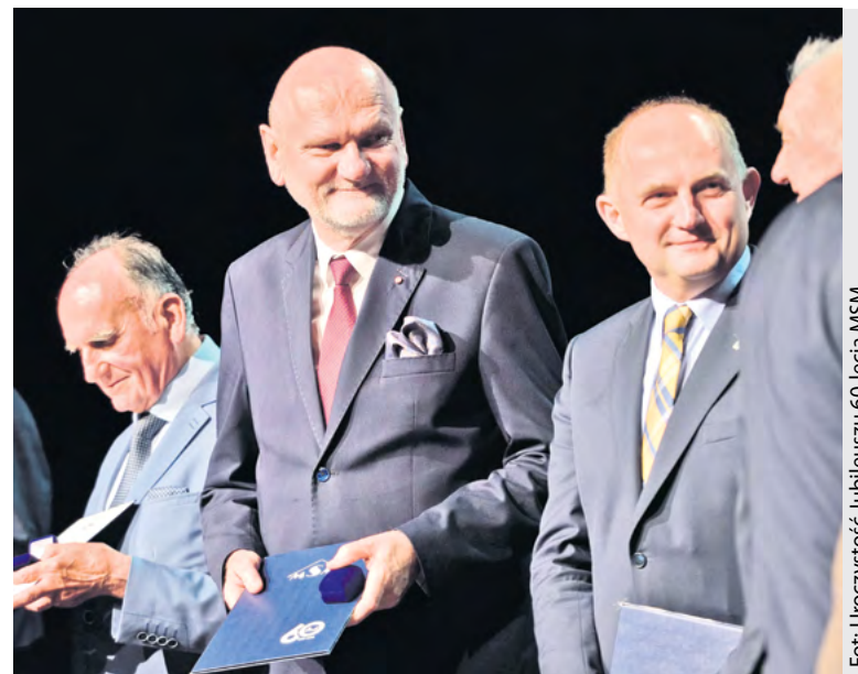
Fot: Uroczystość Jubileuszu 60-lecia MSM

samiane zazwyczaj w znaczeniu semantycznym, nie tylko w rodzimym piśmiennictwie, z ekonomią. Anglojęzyczne economy to bowiem odpowiednik bogactwa i zasobów danego obszaru głównie pod względem wielkości i struktury produkcji i konsumpcji dóbr. Tymczasem ekonomia należąca do nauk społecznych analizujących produkcję, dystrybucję i konsumpcję od strony alternatyw efektywnego funkcjonowania jednostki i - co niezmiennie się zakłada - społeczeństwa, pozostaje przynajmniej od bez mała trzech stuleci tylko jednym ze środków służących gospodarowaniu społecznemu. Celowi temu służą także - oprócz innych nauk społecznych - bezpośrednio i pośrednio nauki techniczne i humanistyczne. Ekonomia na podstawie przede wszystkim rynkowych relacji podmiotów kupujących i sprzedających dobra (w tym zasoby) o różnej względnej rzadkości występowania zmusza ma, wobec przyjmowanej nieogra-