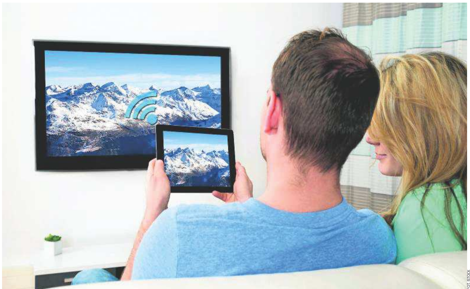
Wiele usług telekomunikacyjnych od jednego dostawcy to rozwiązanie nie tylko korzystne finansowo ale przede wszystkim wygodne

Aktualnie już około 80 proc. przepustowości wykorzystywanych jest na transfer materiałów video. Ten trend jest rosnący. Obecnie z bezpiecznym zapasem spełniamy wysokie wymagania techniczne naszych klientów, ale mając świadomość ich rosnących potrzeb, dzięki prowadzonej przez nas modernizacji sieci, będziemy dobrze przygotowani na nowe wyzwania sto-