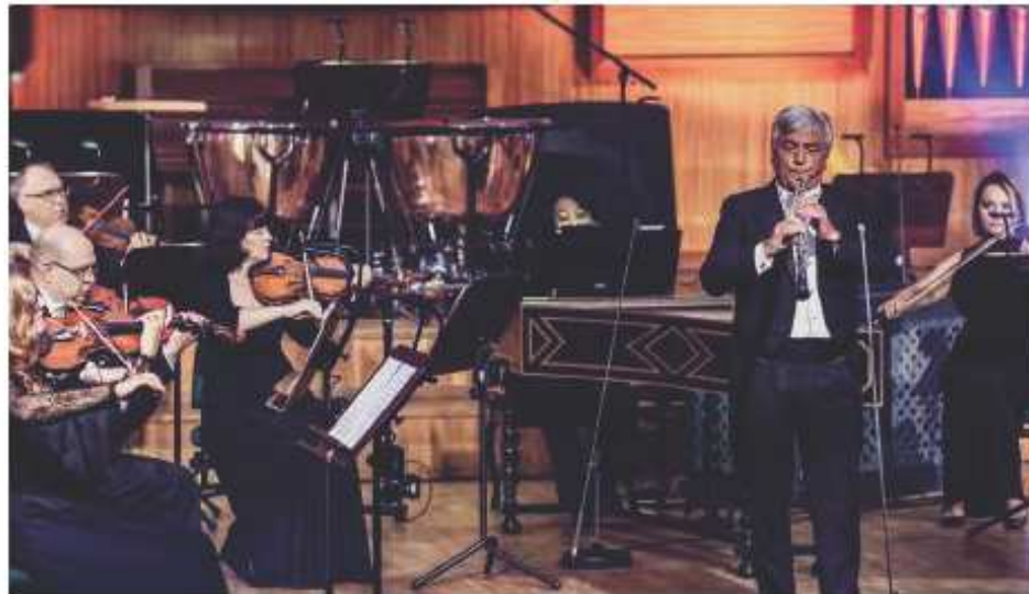
Koncert w Filharmonii Pomorskiej w Bydgoszczy