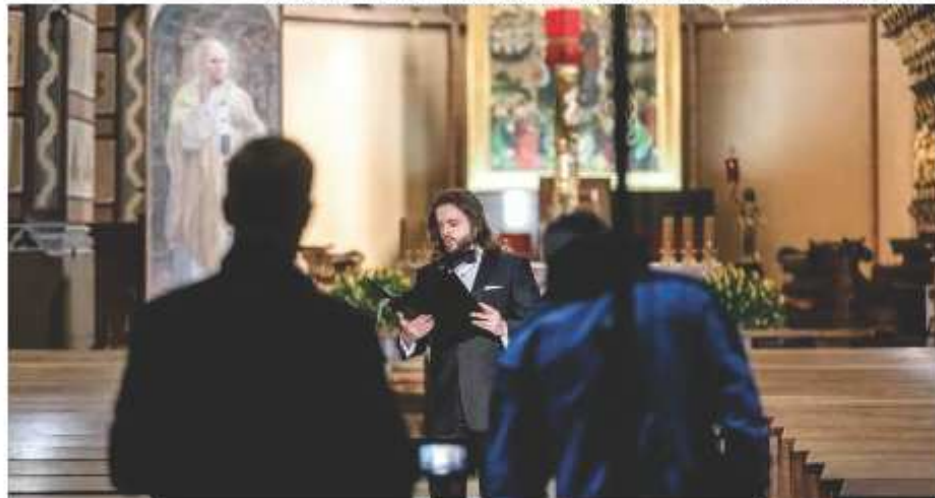
Koncert w katedrze Wniebowzięcia Najświętszej Maryi Panny we Włocławku, fot. Mikołaj Kuras dla UMWKP