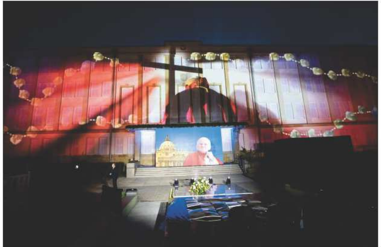
Projekcja multimedialna na budynku Urzędu Marszałkowskiego w Toruniu