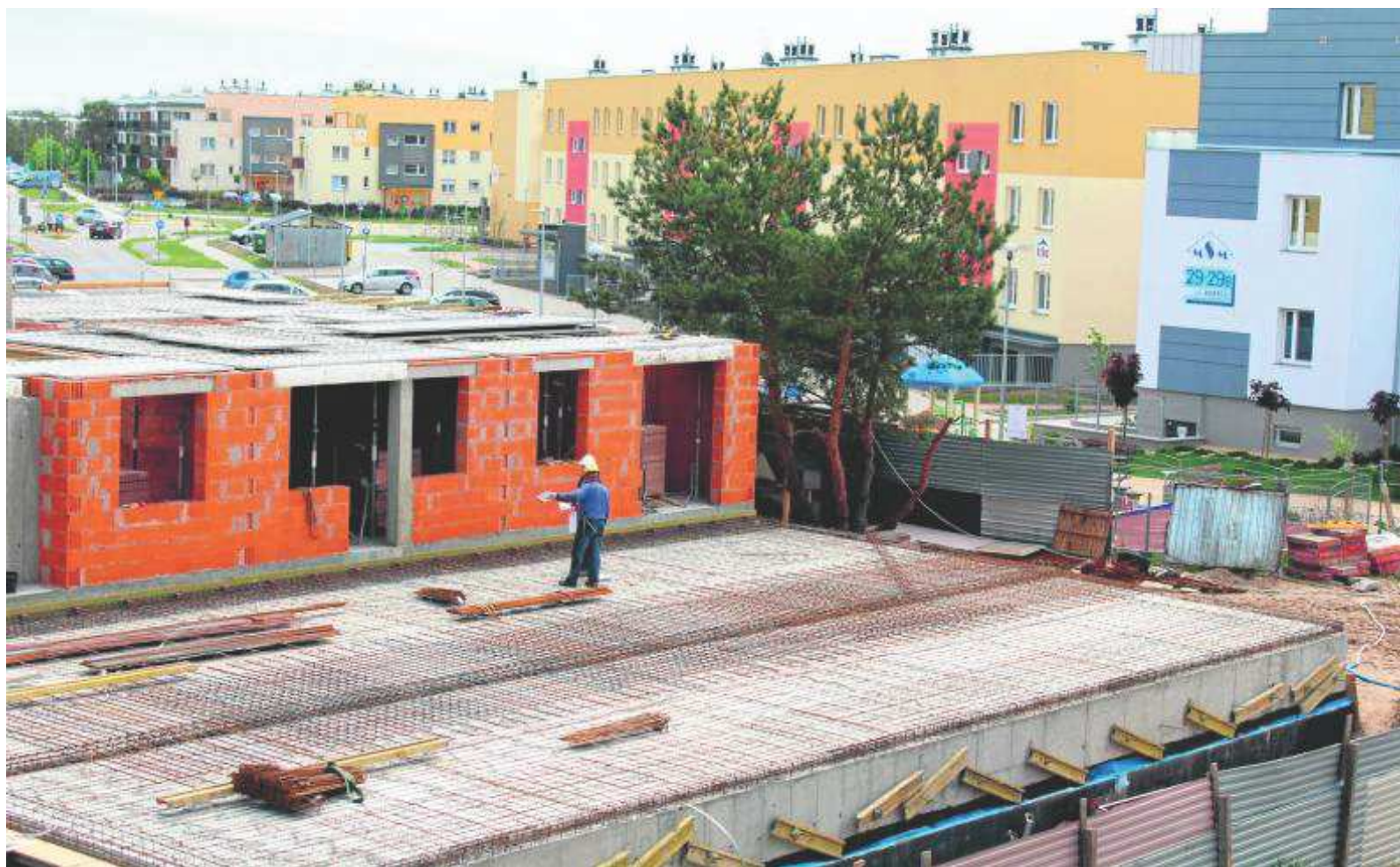
Celem MSM jest tworzenie przyjaznych do życia osiedli wyposażonych w niezbędną infrastrukturę i miejsca odpoczynku

Uwagę skupiamy na tworzeniu funkcjonalnych układów mieszkań. Na etapie koncepcyjnym, a później projektowym wiele pracy i energii poświęcamy każdemu projektowi. Pomimo funkcjonalnych rozwiązań architektonicznych istnieje możli-