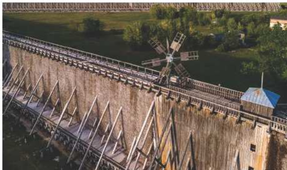
Tężnie w Ciechocinku, fot. Szymon Zdzieblo/tarantoga.pl

Inwestorem rewitalizacji jest Uzdrawisko Ciechocinek, które administruje kompleksem tężni w imieniu samorządu województwa. W wyniku przetargu spółka wyłoniła wykonawców inwestycji – jest to konsorcjum płockich firm: Firma Remontowo-Budowlana Lipowski oraz Zakład Usług Budowlanych Arbi Robert Zakrzewski i Usługi Blacharsko-Dekarskie Marzena Seklecka. Rewitalizacja dotyczy dwóch zabytkowych tężni – drewnianych obiektów mierzących 15 metrów wysokości i 10 metrów szerokości. Długość tężni nr 1 to 655 metrów, tężnia nr 3 mierzy 363 metry długości. Zakres inwestycji obejmuje odtworzenie zniszczonych elementów konstrukcyjnych, w tym wymianę drewnianych pali, oraz naprawę fundamentów. Wyremontowane zostaną pomosty górne i dolne oraz zbiorniki solankowe. Tężnie pokryje nowa tarnina. Renowację przejdzie zabytkowy wiatrak tężni nr 3 (obecnie nieczynny, przed laty służący do tłoczenia solanki z wykorzystaniem siły wiatru). Obiekty zostaną dobrze