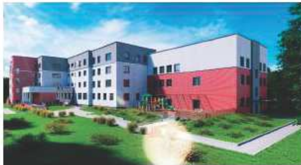
Wizualizacja powstającego budynku SOSW im. Korczaka w Toruniu

Uczniowie Kujawsko-Pomorskiego Specjalnego Ośrodka Szkolno-Wychowawczego im. Janusza Korczaka w Toruniu będą uczyć się zawodu w nowoczesnych pracowniach. Powstanie tu też przedszkole dla dzieci ze specjalnymi potrzebami. W „Korczaku” właśnie ruszyły prace budowlane.