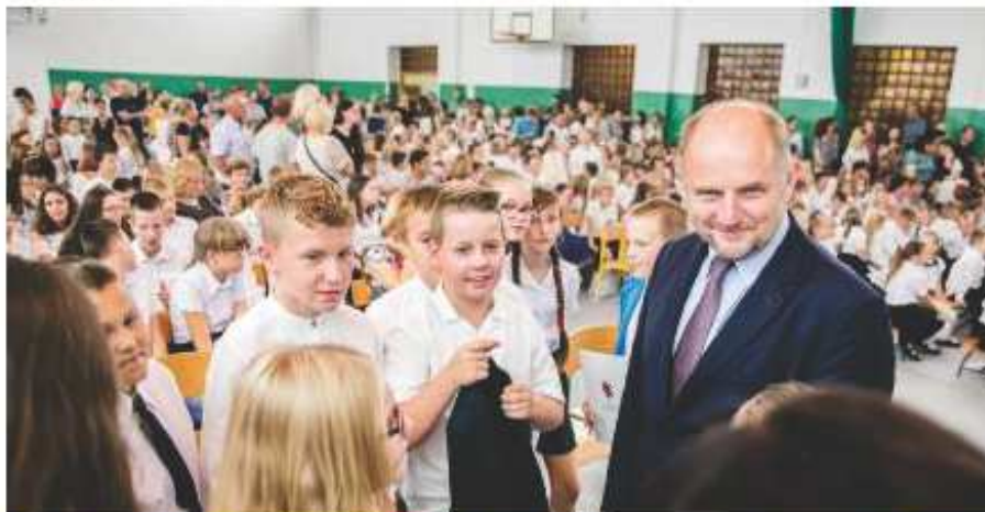
Urząd Marszałkowski przygotowuje w tym roku stypendia dla 2 tysięcy zdolnych uczniów. Na zdjęciu marszałek województwa Piotr Całbecki na inauguracji roku szkolnego 2019/2020 z Zespołem Szkół nr 2 w Brzeźcu Kujawskim (powiat włocławski).

Nie zapominamy też o młodych mieszkańcach regionu, którzy osiągają bardzo dobre wyniki z przedmiotów humanistycznych. Chodzi o uczniów z klas VII i VIII podstawówek oraz liceów ogólnokształcących, którzy z historii i języka polskiego uzyskali średnią co najmniej 4,5 oraz są laureatami lub finalistami ogólnopolskich olimpiad z przedmiotów humanistycznych albo konkursów organizowanych w naszym regionie. W roku szkolnym 2018/2019 comiesięczne stypendium otrzymało 366. W nowym roku szkolnym zdecydowaliśmy o przyznaniu stypendium dla większej ilości osób niż w roku ubiegłym. Comiesięczne wsparcie w wysokości od 200 do 400 zł może otrzymać 700 młodych ludzi.