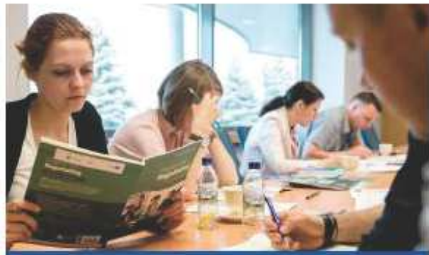
Na osoby zainteresowane nauką języka obcego czeka 7 tysięcy bezpłatnych miejsc szkoleniowych.

Zapraszamy mieszkańców województwa kujawsko-pomorskiego do uczestnictwa w marszałkowskich szkoleniach językowych z języków angielskiego, niemieckiego i francuskiego. Na chętnych czeka prawie 7 tysięcy miejsc. Zapisy za pomocą formularza zgłoszeniowego na stronie internetowej www.projektmowiszmasz.pl .