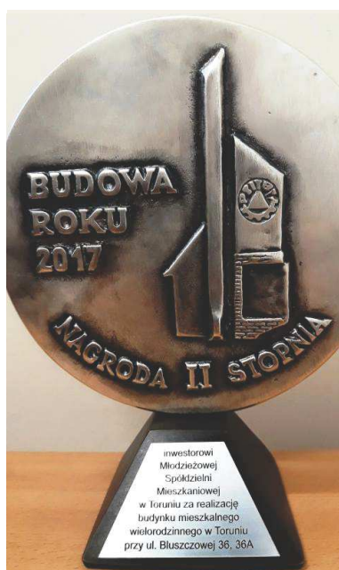
Statuetka nagrody dla Budowy Roku 2017

Największy plac budowy w Toruniu to w tej chwili osiedle Jar. Ponieważ MSM buduje mieszkania dla torunian od sześćdziesięciu lat to nie mogło nas zabraknąć i na tym osiedlu. Budowę pierwszych budynków rozpoczęliśmy na Jarze już w 2014 roku. Do tej pory wybudowaliśmy tam już dziesięć obiektów, a w nich oddaliśmy do użytku 395 mieszkań. W tej chwili trwają prace budowlane przy kolejnych sześciu budynkach. Dwa z nich będą mogły być zamieszkane jeszcze w tym roku, a pozostałe w kolejnych latach. Obecne nasze plany budowlane