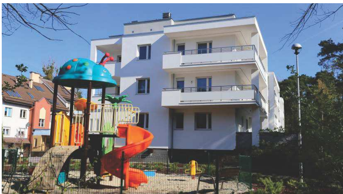
Nagrodzony budynek przy ul. Bluszczowej 36-36a

Można więc powiedzieć, że w tym konkursie budynki oceniają prawdziwi fachowcy.