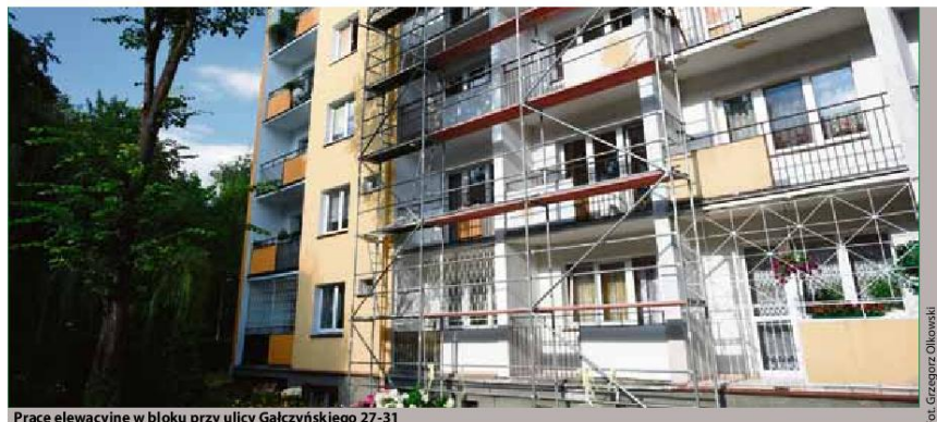
Prace elewacyjne w bloku przy ulicy Gałczyńskiego 27-31

- malowanie klatek schodowych w budynkach Przy Kaszowniku 35, W. Polskiego 47,51, Sienkiewicza 25, Grudziądzka 4a, Letniej 21-23b, Witkowskiego 10-12, Wybickiego 23-23c, Kołłątaja 5-5d, 17-17a, 19, Lelewela 44-46, 50, Kordeckiego 8-8a, Matejki 61, PKC 21-25, Kochanowskiego 28-28a, Tuwima 11,13;