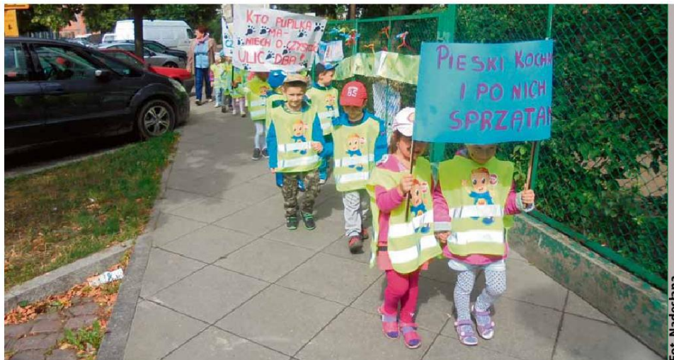
Przedszkolaki z Leśnego Ludka

Do realizacji efektywnego projektu nie zawsze potrzeba wielkich pieniędzy. Często wystarczy pomysł, zapał i włączenie do działania mieszkańców, zwłaszcza najmłodszych. Dzieci wykonały świetną robotę, ale podziękowania należą się również paniom koordynatorom oraz dyrektorom placówek, którzy poświęcili swój czas i energię, a przede wszystkim dostrzegli sens podobnych działań. Wszak od tego wszystko się zaczy-