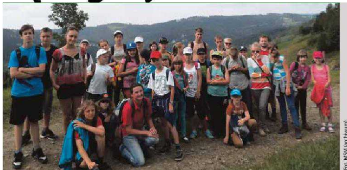
Wspomnienie pobytu w Wiśle w 2013 roku

Szczegółowych informacji na temat wyjazdu będzie można zaczerpnąć osobiście w Klubie „Kameleon” przy ul. Tuwima 9 bądź telefonicznie pod nr. 56 622 56 64.