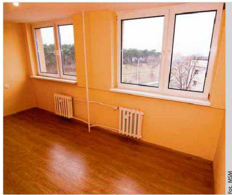
Oferta mieszkania przy ulicy Kraszewskiego, cena 178 tys. złotych