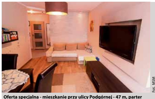
Oferta specjalna - mieszkanie przy ulicy Podgórnego - 47 m, parter 299 tys. złotych