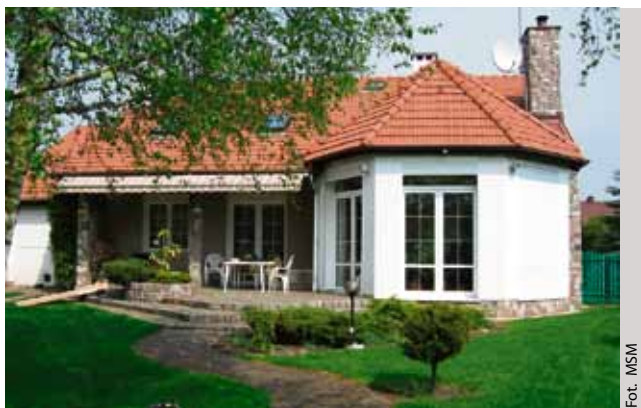
Oferta specjalna - dom w Brzozówce, 316 m, działka 3000, 879 tys.

▶ Grębocin, 1955 m, 200 tys. ▶ Grębocin, 544 m, 61 tys. ▶ Rudak, 300 m, 300 tys.