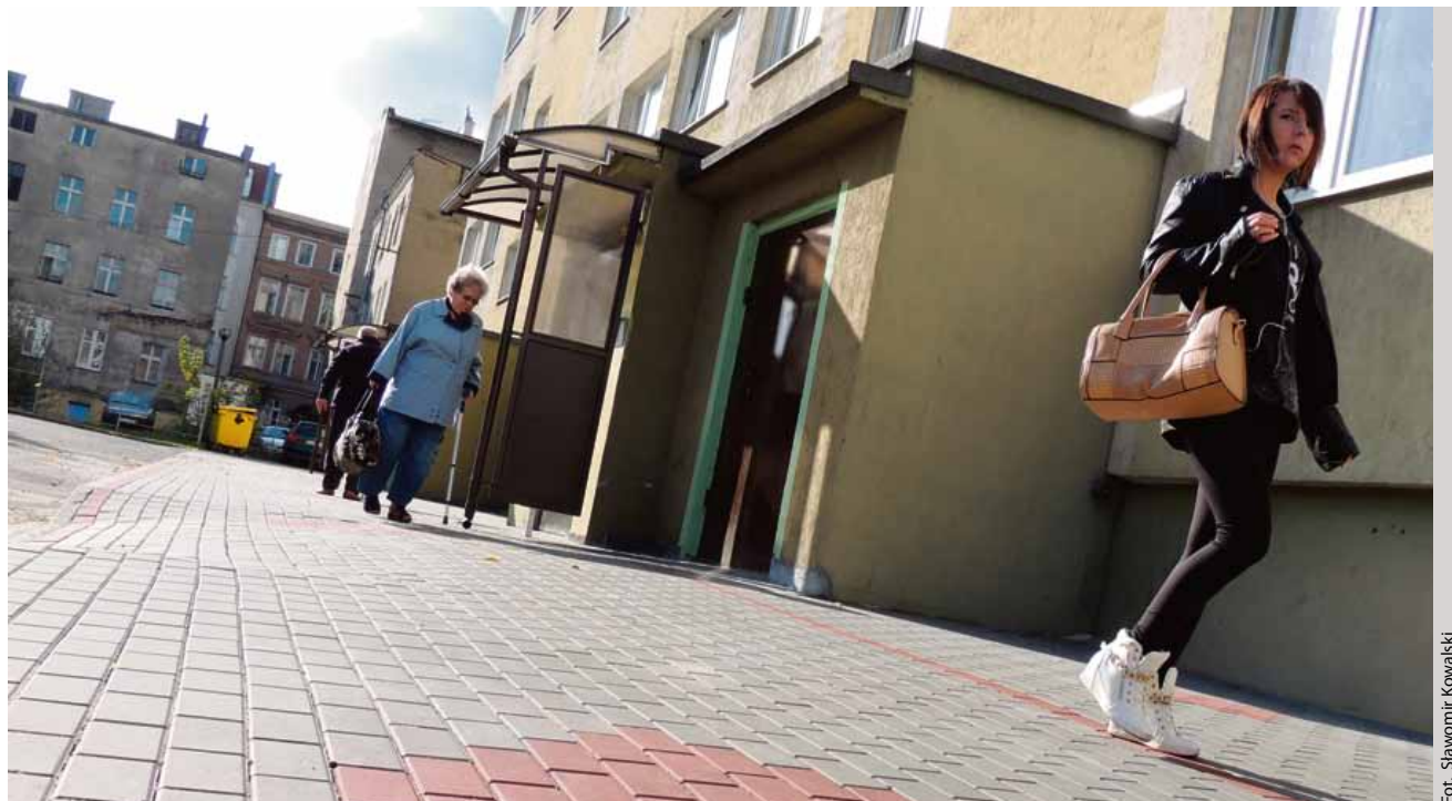
Dobre stosunki z sąsiadami to jeden z warunków przyjemności z zamieszkiwania w spółdzielczej wspólnocie

W tym wypadku katowiczanie mogą zgłosić sprawę na policję lub bezpośrednio do prokuratury. Aby doszło jednak do postawienia zarzutów, trzeba będzie udowodnić uporczywość działań sąsiadki oraz istotne naruszenie prywatności. Przystępstwo tzw. stalkingu (czyli uporczywego nękania bądź prześladowania ofiary) może być w tym wypadku trudne do udowodnienia. Można również wytoczyć powództwo na drodze cywilnej - wnosząc pozew do sądu o zadośćuczynienie, czyli odszkodowanie za krzywdę.