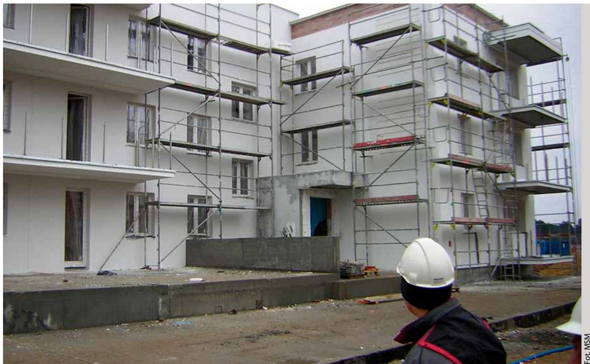
Budynek przy ulicy Watzenrodego 11-11B na osiedlu JAR

Przyjęte rozwiązania związane z ochroną ciepłą spełniają warunki ochrony cieplnej przewidziane dla budynków budowanych w 2021 roku. Na ścianach zewnętrznych budynków, stropach ostatniej kon-