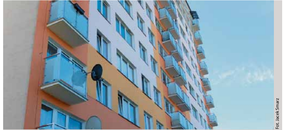
Budynek przy ulicy Warnerczyka 6-8 z odnowioną elewacją

W trzydziestu dwóch budynkach zalegalizowanych zostanie 2600 urządzeń. Legalizacja poprzez wymianę dotyczyć będzie również