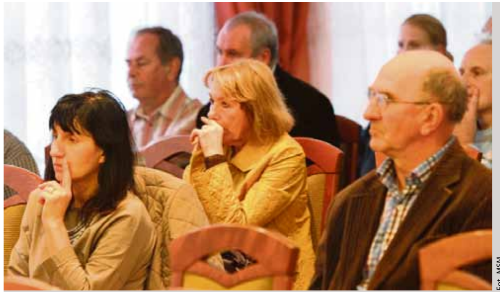
Spółdzielcy nie chcą, aby ktoś decydował za nich o losie spółdzielni

► pozbawienie związków rewizyjnych prawa przeprowadzania lustracji