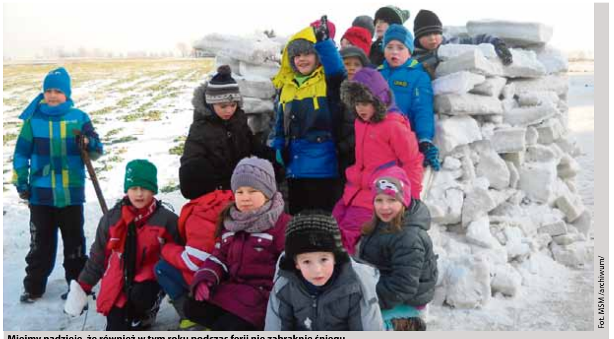
Miejmy nadzieję, że również w tym roku podczas ferii nie zabraknie śniegu

Drugi tydzień zimowego wypoczynku rozpocznie wyjście do kina na film animowany. We wtorek dzieciaki będą bawić się w Lucky Star Plaza, a we środę wyjadą do Family Parku w Bydgoszczy. Będą miały moż-