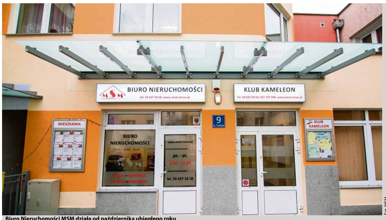
Biuro Nieruchomości MSM działa od października ubiegłego roku

- W zakresie naszych usług, podobnie jak na Skarpie, mieści się weryfikacja stanu prawnego nieruchomości, jej wycena, prezentacja klientowi oraz kompletowanie wszystkich niezbędnych dokumentów potrzebnych do przeprowadzenia transakcji. Ponadto wspieramy klientów w uzyskaniu finansów na zakup nieruchomości, a więc w obsłudze kredytowej, negocjacji w ich imieniu warunków umowy oraz pomagamy przy finalizacji transakcji przed notariuszem