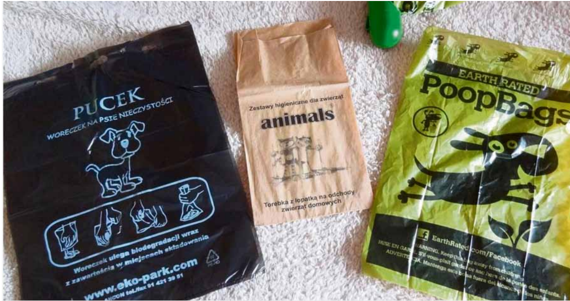
Ekologiczne akcesoria przeznaczone do sprzątania po naszych czworonogach

Nasz projekt składa się ze scenariuszy przygotowanych dla uczniów