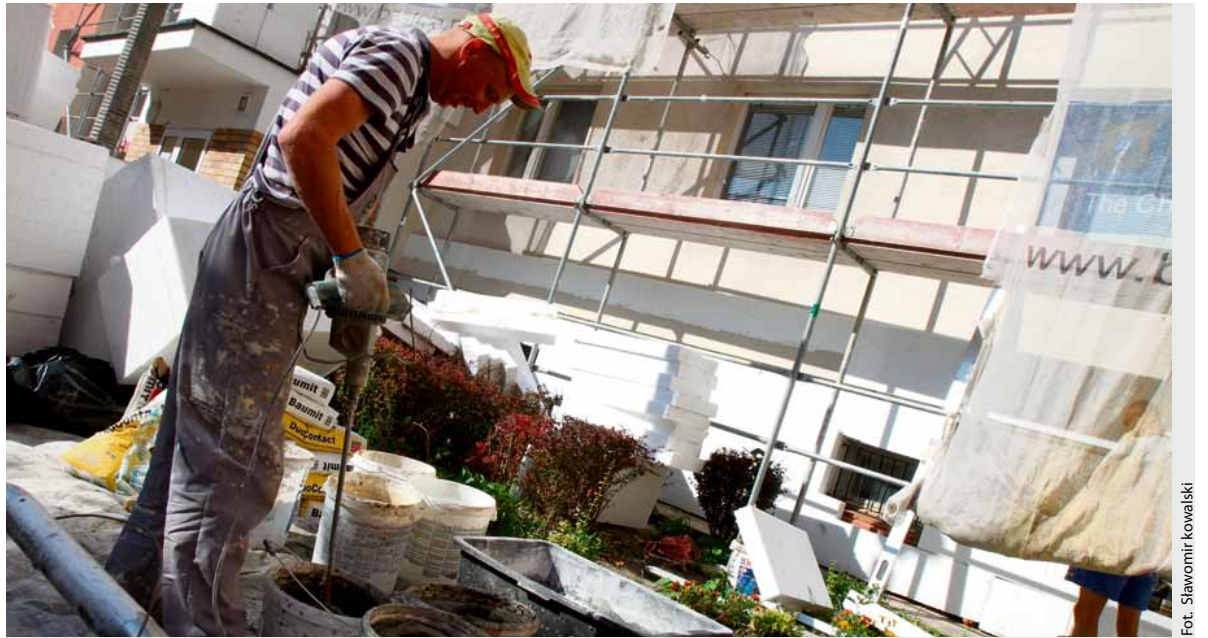
Prace remontowe budynku przy Kołłątaja 12-16

Wykonano i zamontowano płotki ogrodzeniowe przy ul. Kołłątaja 31-31E, 17-19, Lelewela 2-2B, Małachowskiego 26-26B, 28-28A, Wiązowej 9 i Żelaznej 5-5B. Do końca roku wymienione zostaną okna w piwnicach przy Wybickiego 21-21C, 23-23C, 19-19C, 34-40, 22-22E, 16-16D, Lelewela