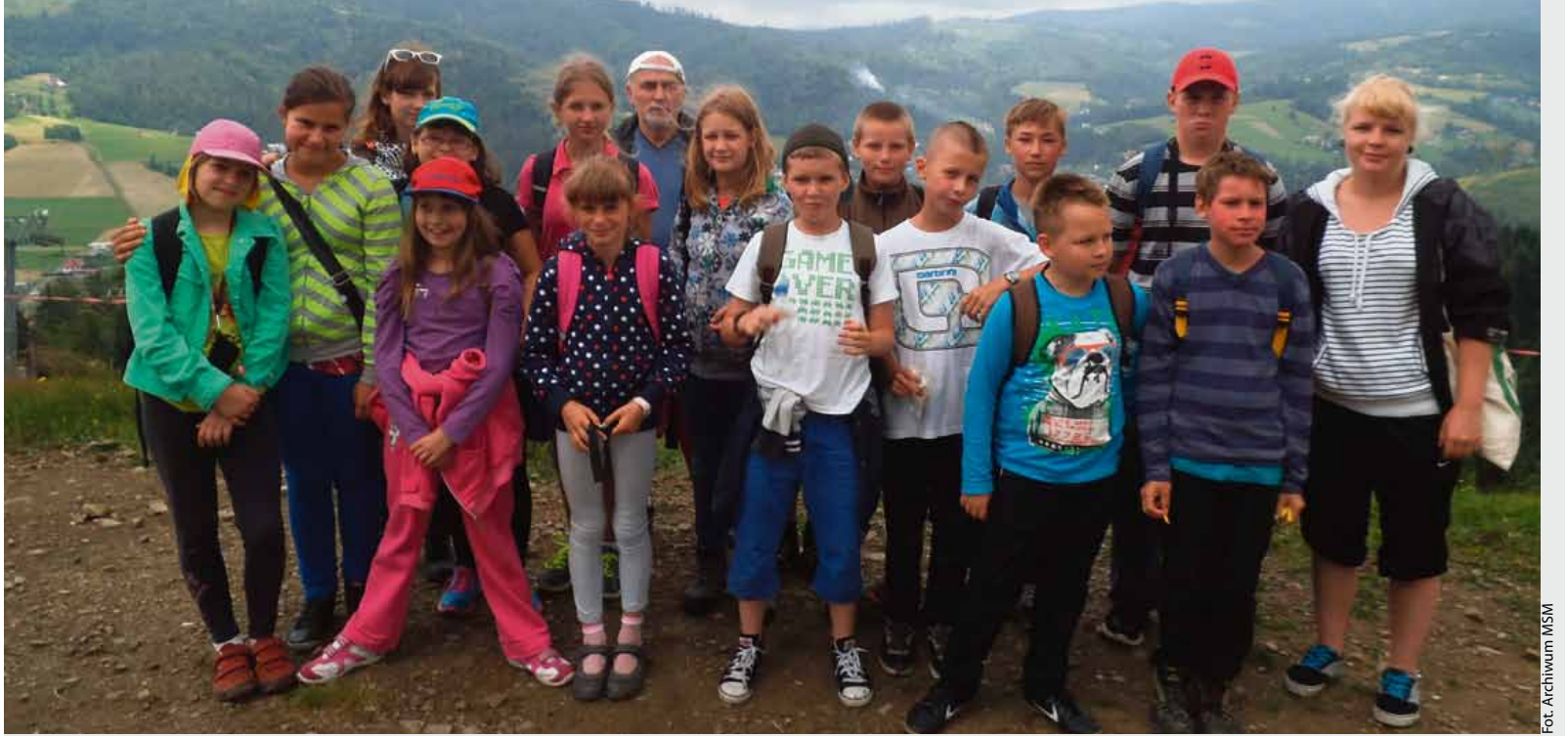
Kolonie letnie organizowane przez kluby MSM cieszą się dużym powodzeniem. W ubiegłym roku młodzież wyjechała w góry

Wśród grona różnorodnych atrakcji możemy wymienić i te przeznaczone dla osób lubiących aktywne spędzanie wolnego czasu, i te dla osób pragnących spokoju oraz relaksu. Ci, którzy lubią wypoczywać mogą skorzystać z wycieczki do term, zaś preferujący aktywny wypoczynek mogą skusić się na wyjazd do Zako-