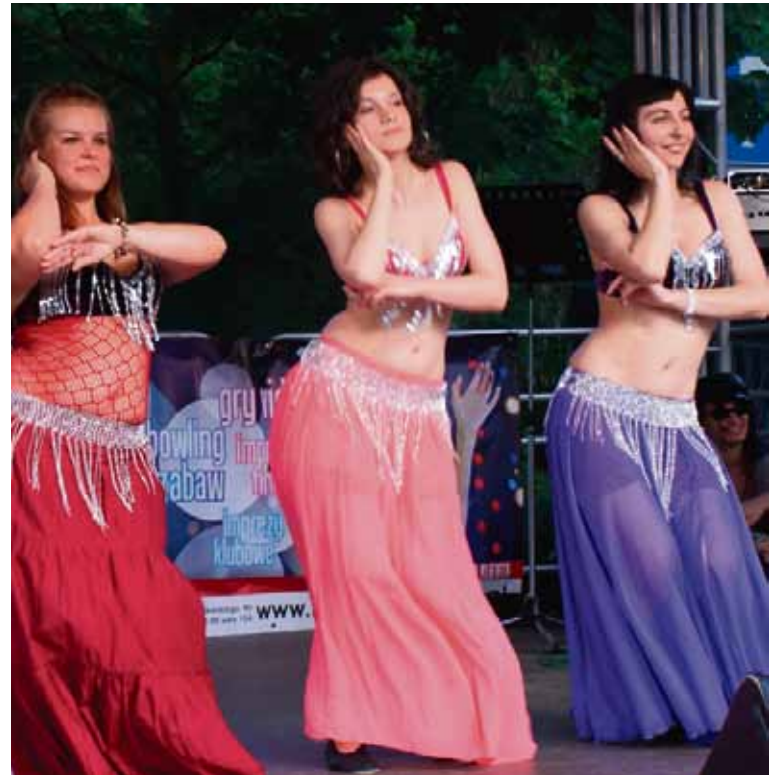
Na początku panie niechętnie odnosiły się do publicznych występów...

gdzie pokazują wyćwiczoną przez nas wspólnie choreografię – mówi instruktorka.