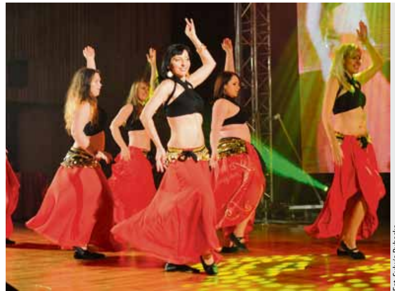
... teraz sprawia im to już przyjemność i daje sporo satysfakcji

Taniec brzucha mylnie utożsamiany jest z tańcem, w którym najważniejszym elementem jest odkryty brzuch. Często jest on osłaniany (tiulem, koronkami bądź innymi lekkimi materiałami). W typowych arabskich tańcach folklorystycznych wskazane jest, aby tańczyć w okryciu. Kobieta ćwicząca nie musi być szczupła. Warto pamiętać, że początkowo kobiety tańczące nie były utożsamiane z chudymi modelkami. Co ważne, w tańcu praktycznie każdy brzuch wygląda dobrze.