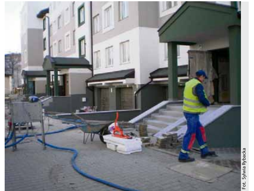
Budynek przy ulicy Witkowskiego 7 będzie oddany do użytku w kwietniu

Budynek przy ul. Hurynowicz 9 jest najlepszym dowodem na to, że nieruchomości budowane przez Młodzieżową są konkurencyjne nie tylko na rynku lokalnym, ale również ogólnopolskim. Zgłoszony do konkursu Polskiego Związku Inżynierów i Techników Budownictwa „Budowa roku 2013” budynek został zakwalifikowany do drugiego