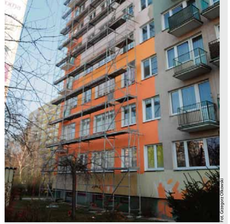
Remont elewacji w bloku przy ulicy Warneńczyka 6/8

- Kontynuacja rozpoczętej w 2011 r. wymiany okien piwnicznych, w br. planujemy wymianę w kolej-