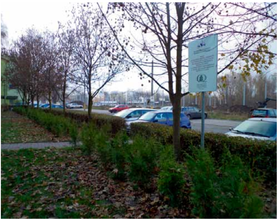
Jeszcze w pierwszej dekadzie stycznia aura przypominała polską złotą jesień