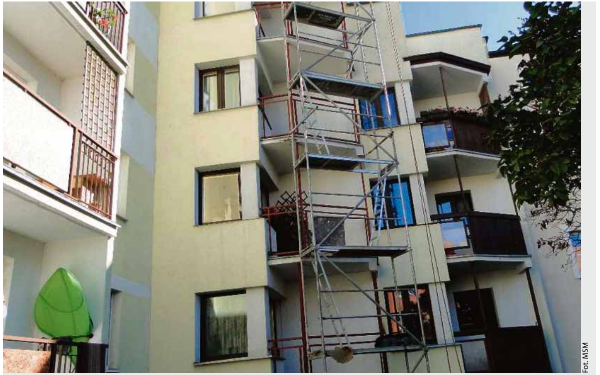
Remont balkonów w bloku przy ulicy Legionów 49

Młodzieżowa opracowała wieloletni plan remontowy, który stanowi swego rodzaju szkielet planów remontowych w poszczególnych latach. Podstawową przesłanką opracowania wieloletniego planu remontów było ujednoczenie standardów technicznych dla całych zasobów Spółdzielni. Dzięki temu już teraz możemy wstępnie powiedzieć, jakie najważniejsze prace będą wykonywane w danym roku. W roku bieżącym planowana jest kontynuacja programu likwidacji term gazowych, która poprawia bezpieczeństwo użytkownika najstarszych budynków osiedla Młodych i dostosowanie do obecnych przepisów. Najprawdopodobniej zakończy się on w roku 2015, jednakże należy pamiętać, że termin realizacji jest zależny od operatora sieci ciepłowniczej EDF. Realizowana będzie także dalsza legalizacja wodomierzy i ciepłomierzy poprzez ich wymianę na nowoczesne z odczytem radiowym. Realizowany jest również wieloletni plan wymiany dźwigów osobowych. W bieżącym roku zostaną wymienio-