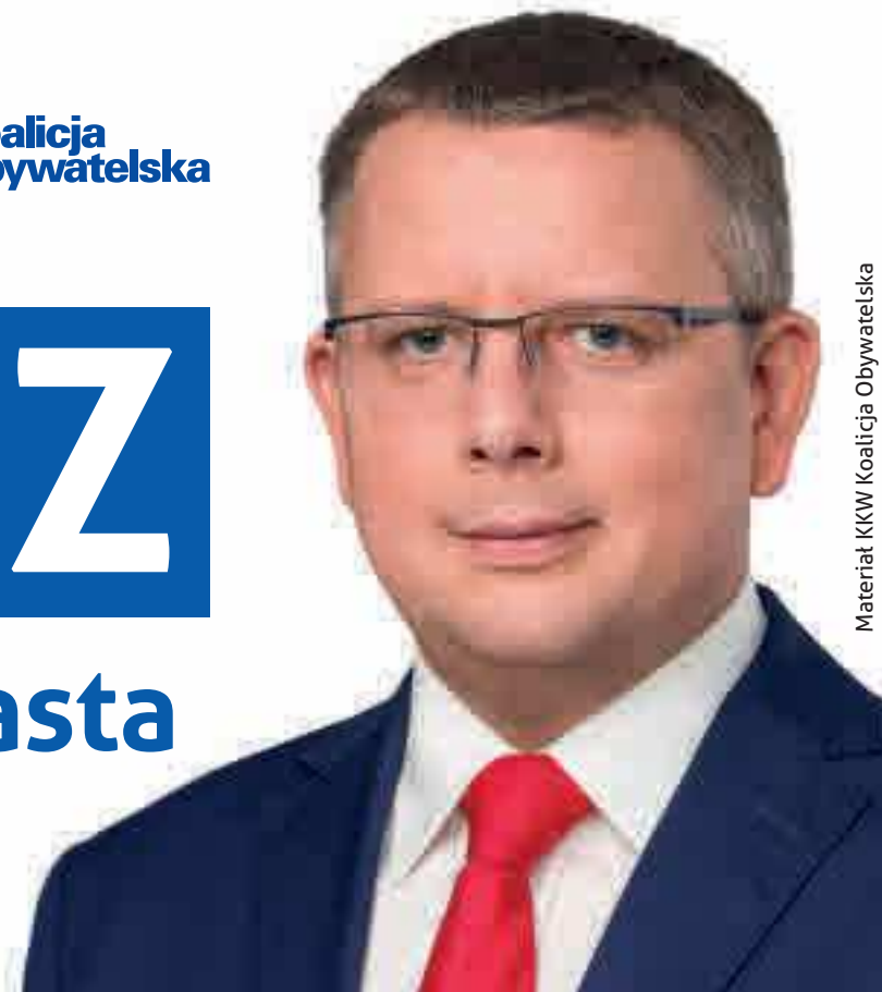
Materiał KKW Koalicja Obywatelska