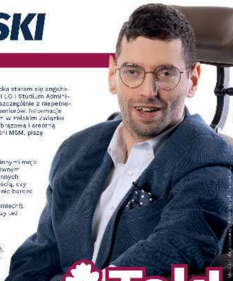
Materiał KKW Koalicja Obywatelska

Taki Corocznie kwestuję na rzecz odnowy zabytkowych grobowców. To nasza historia. Trzeba o to dbać. Regularnie wspieram jak mogę akcje charytatywne, angażuję się w zbiórki na rzecz chorych, wykluczonych i na rzecz zwierząt. Mimo wielu ograniczeń to jedno mogę oddać – serce i zaangażowanie. Tak już jest i nie już tego nie zmieni.