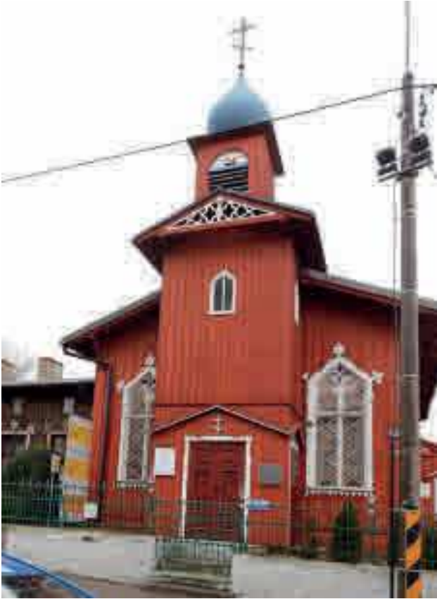
Marszałkowskie środki na ochronę zabytków umożliwią w tym roku prace w 201 obiektach w całym regionie. Remont konserwatorski będzie kontynuowany między innymi w cerkwi pw. św. Mikołaja (na zdjęciu).

Blisko 17 mln złotych wynosi tegoroczne wsparcie przekazane przez samorząd województwa na remonty konserwatorskie, prace restauratorskie i roboty budowlane przy zabytkowych obiektach Kujaw i Pomorza. Dotacje trafią na realizację 201 przedsięwzięć w całym regionie.